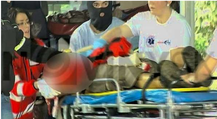
Schwer verletzt liegt der Kannibale auf der Bahre, ein maskierter Polizist bewacht den Abtransport.